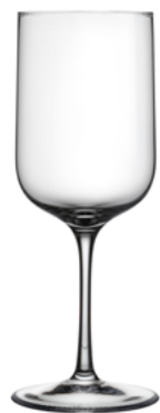
BÍLÉ VÍNO broušená / křišťál 7,5 × 20 cm / 270 ml 30403

Sklenice Decent z bezolovnatého čirého křišťálu s jemným perlovým brusem vznikají díky poctivé ruční práci sklářů, která se vášní a úctou k řemeslu podobá úsilí vinařů. Vytříbený design sklenic podtrhuje barvu, vůni i chuť vína. V těchto sklenkách se snoubí řemeslo, cit i magie okamžiku, kdy si víno opravdu vychutnáte.