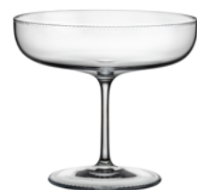
ŠAMPAŇSKÉ broušená / křišťál 11,8×10,6 cm / 200 ml 30409

Tenkostěnné sklenice z nejčistšího křišťálu, zdobené jemným perlovým brusem, okouzlí na první pohled i dotek. Díky svému tvaru nádherně odhalují tanec bublinek a nechávají šampaňské vyniknout v celé jeho kráse. Jsou jako stvořené pro slavnostní chvíle – na stole září svou jedinečnou noblesou.