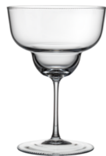
MARGARITA broušená / křišťál 11 x 16 cm / 320 ml 30409/s