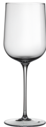
BÍLÉ VÍNO broušená / křišťál 8,5 × 23 cm / 440 ml 30402