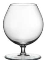
BRANDY broušená / křišťál 8 × 10,3 cm / 260 ml 4669 / III / 30400

Pro ušlechtilé destiláty a likéry jsou sklenice Decent skvělou volbou. Podtrhnou jejich jedinečný charakter, vynikne v nich barva, jiskra i aroma nápoje. Každá degustace tak přináší nezapomenutelný zážitek.