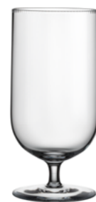
VODA / PIVO broušená / křišťál 7,3 × 15 cm / 400 ml 30416