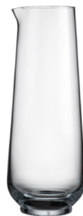
KARAFKA broušená / křišťál 9,2 × 23,8 cm / 800 ml 30400/KAR