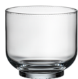
VODA / WHISKY broušená / křišťál 8 × 8,5 cm / 320 ml 30408/O

Karafa a láhev doplňují celý koncept a přirozeně propojují jednotlivé prvky, takže každý detail na stole působí harmonicky a vyváženě.