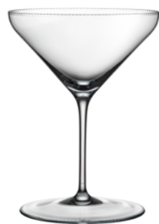
MARTINI broušená / křišťál 11,8 x 16 cm / 220 ml 30409/c

Elegantní sklenice z čirého křišťálu s jemným perlovým brusem jsou ideální volbou pro podávání koktejlů. Každý v nich vynikne jako malé umělecké dílo. Decent přináší nejen osvěžení, ale i stylový zážitek pro všechny smysly.